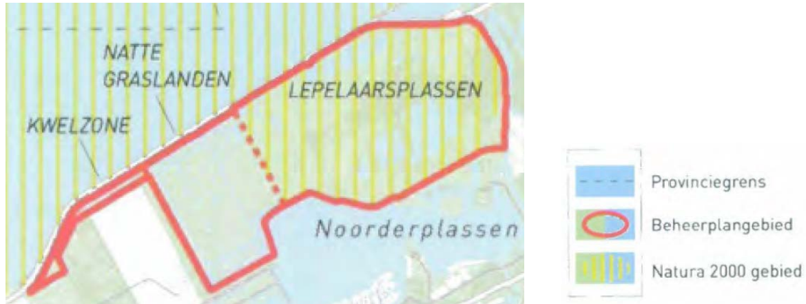
Afb. 4: Het Beheerplangebied van de Lepelaarsplassen

Bij het beheerplan Lepelaarplassengebied is vanwege de ecologische samenhang gekozen voor een integraal beheerplan voor de gebieden Lepelaarsplassen, Natte Graslanden en Kwelzone. (Afb. 1)