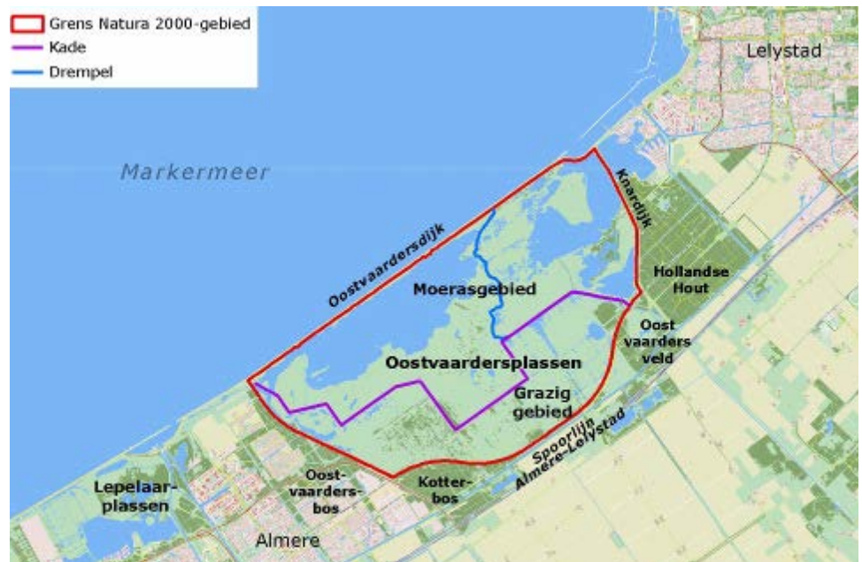
Afb. 2: Het beheerplangebied van de Oostvaardersplassen

Samen vormen het moerasdeel en het grazige deel van de Oostvaardersplassen ecologisch een functionele eenheid.