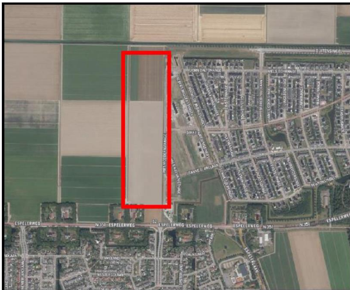
Afbeelding 1 Luchtfoto projectlocatie

De locatie is gelegen ten zuiden van de Onderduikerstocht, ten noorden van de Espelerweg, ten westen van de woonwijk Emmelhage (fase 1) en ten oosten van de Emmeloorderdwarstocht. De ontgroning zal worden gerealiseerd op het kadastrale percelen: gemeente Noordoostpolder, sectie AX, nummers 1557, 1570, 1572 en 1575.