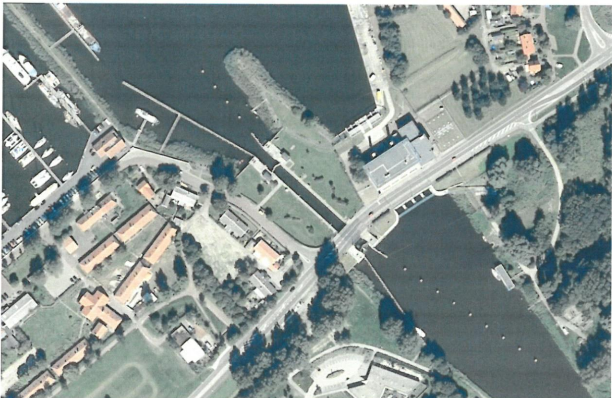
Figuur 3.3 Situatie van de locatie (2006)

De woningen aan de Oostvaardersdijk 9, 11, 17 en 19 zijn in 2006 gesloopt (zie figuur 3.3).