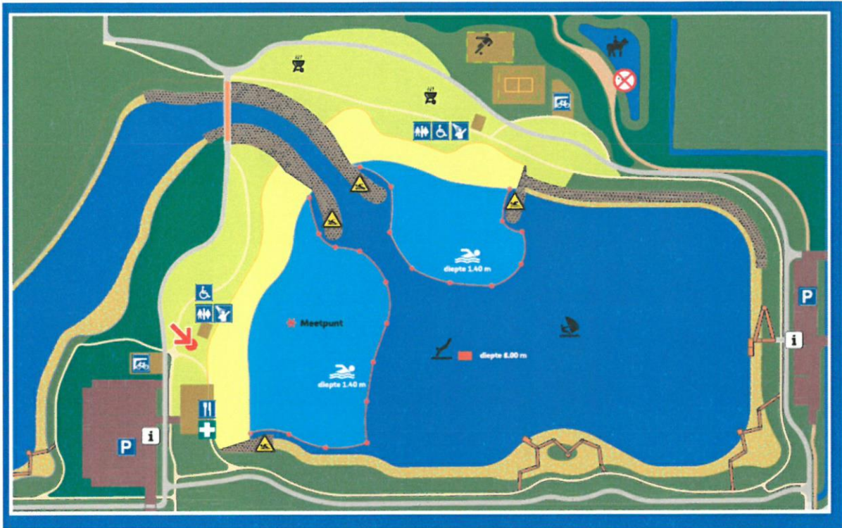
Zwemzone strand Houtribhoek, Lelystad