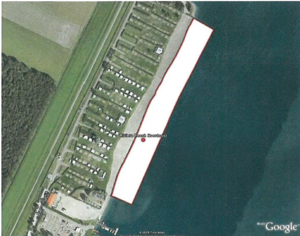
Zwemzone strand Riviera Beach Zuid, Dronten