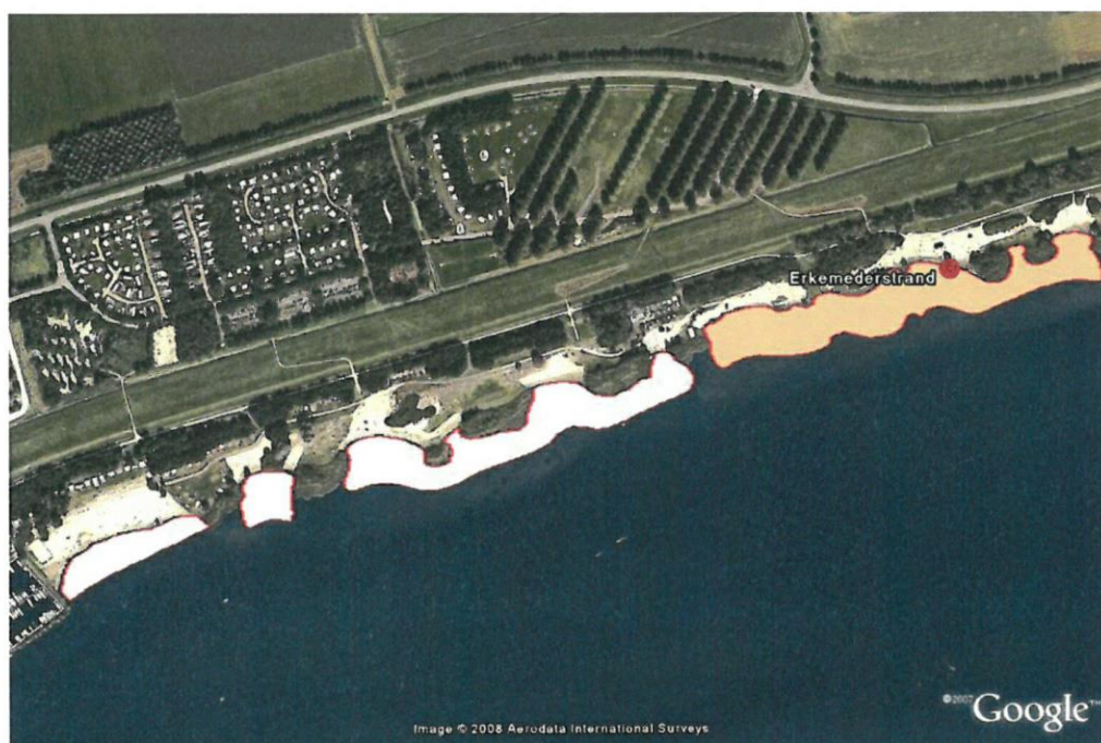
Zwemzone Laakse Strand, Zeewolde