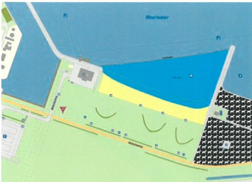
Zwemzone Lumièrestrand 't Weerwater, Almere