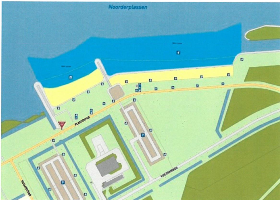
Zwemzone Strand in Zicht, Almere