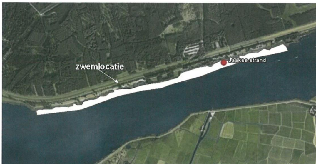
Zwemzone Zwemstrand Almere-Haven