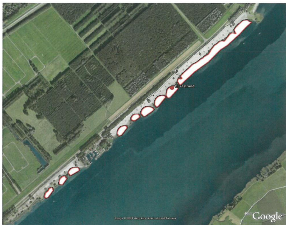
Zwemzone Harderstrand, Dronen