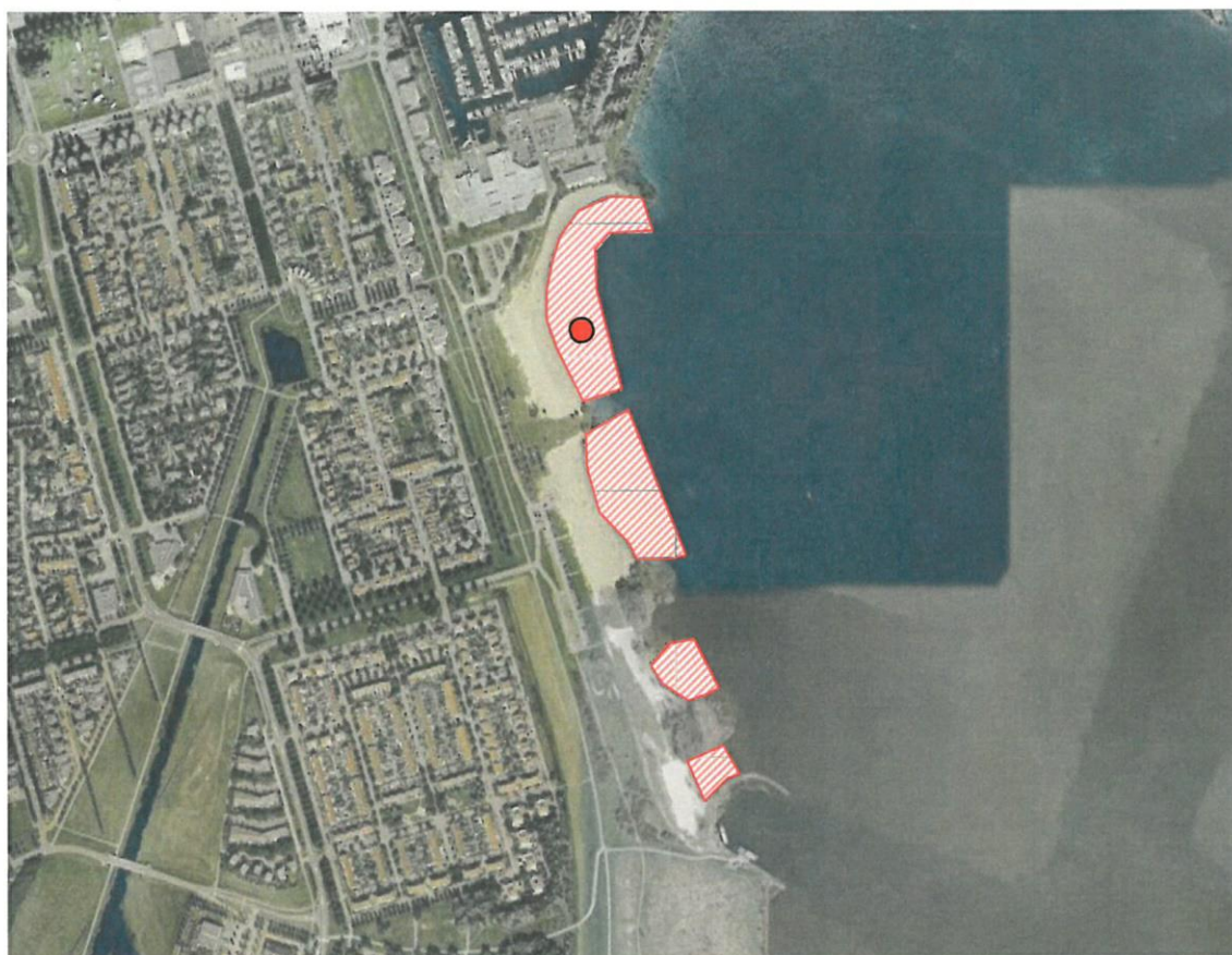
Zwemzone Erkermederstrand, Zeewolde