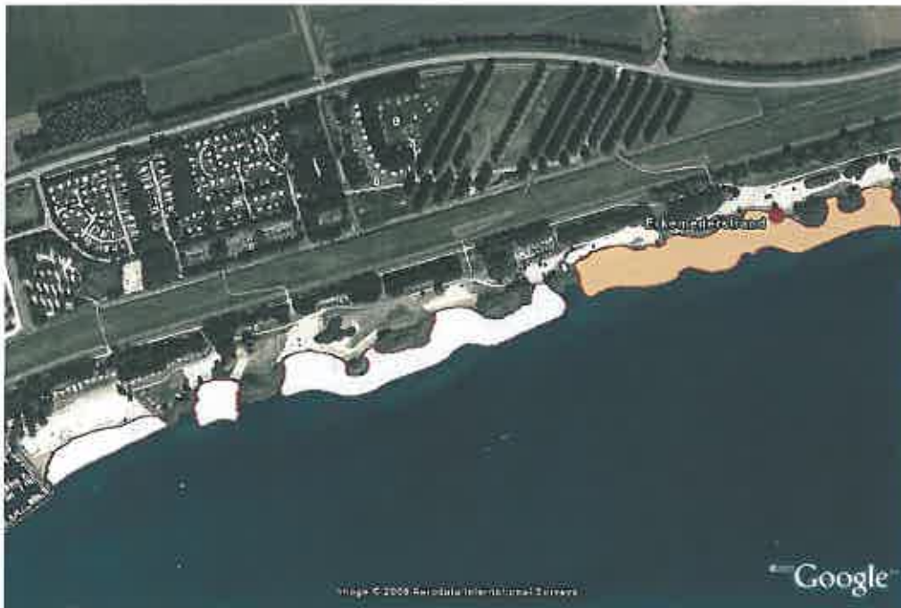
Zwemzone Laakse Strand, Zeewolde