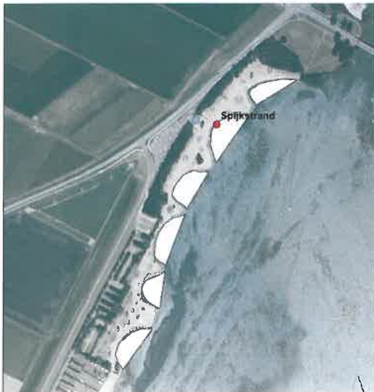
Zwemzone strand Riviera Beach Noord, Dronten