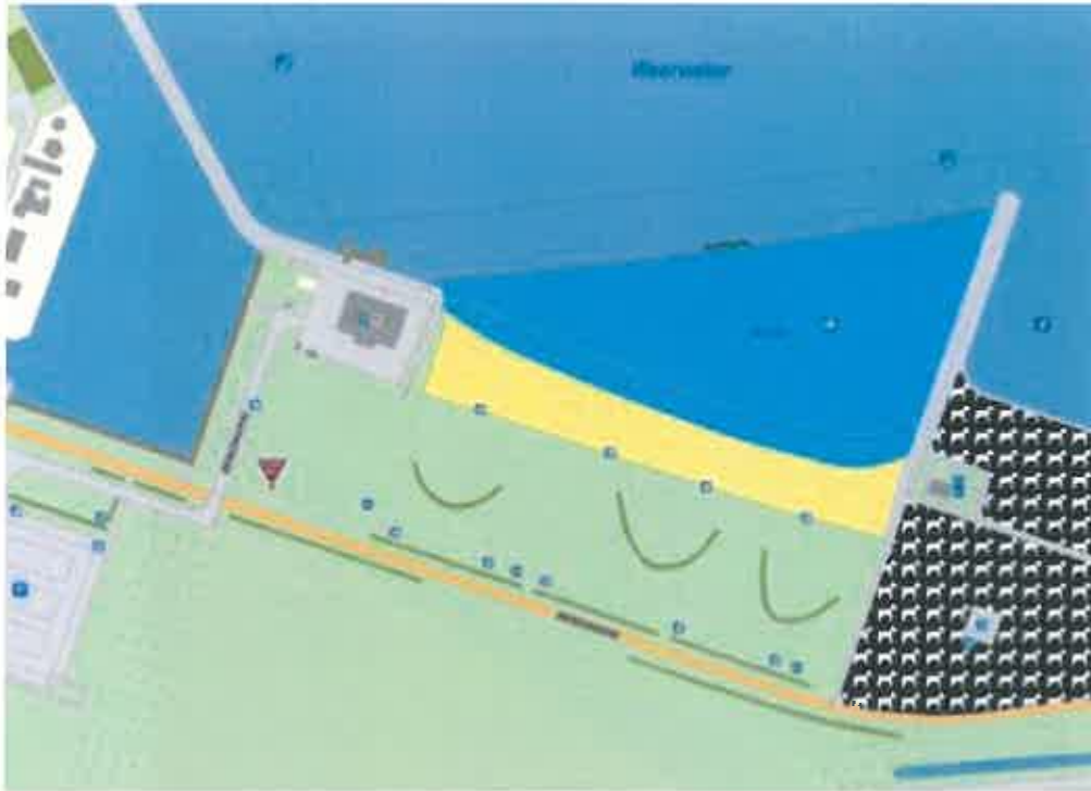
Zwemzone Lumièrestrand 't Weerwater, Almere