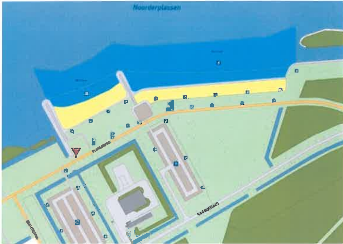
Zwemzone Strand in Zicht, Almere