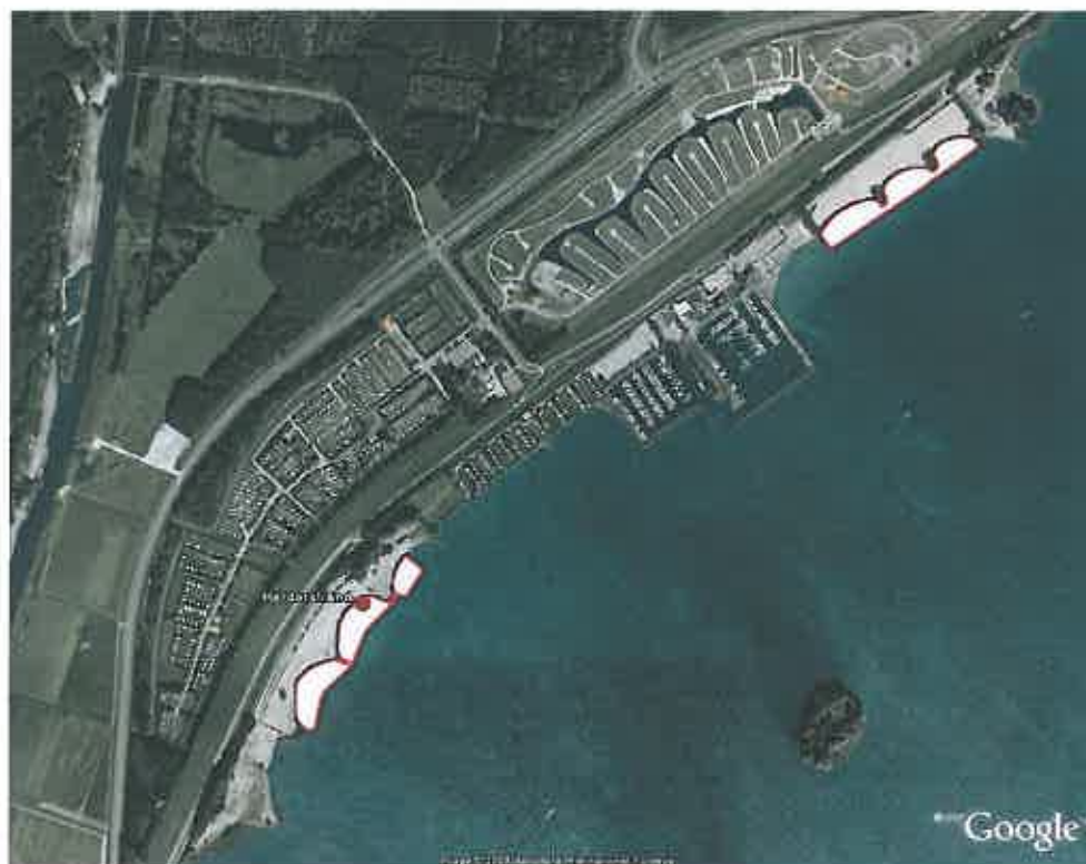
Zwemzone Woldstrand, Zeewolde