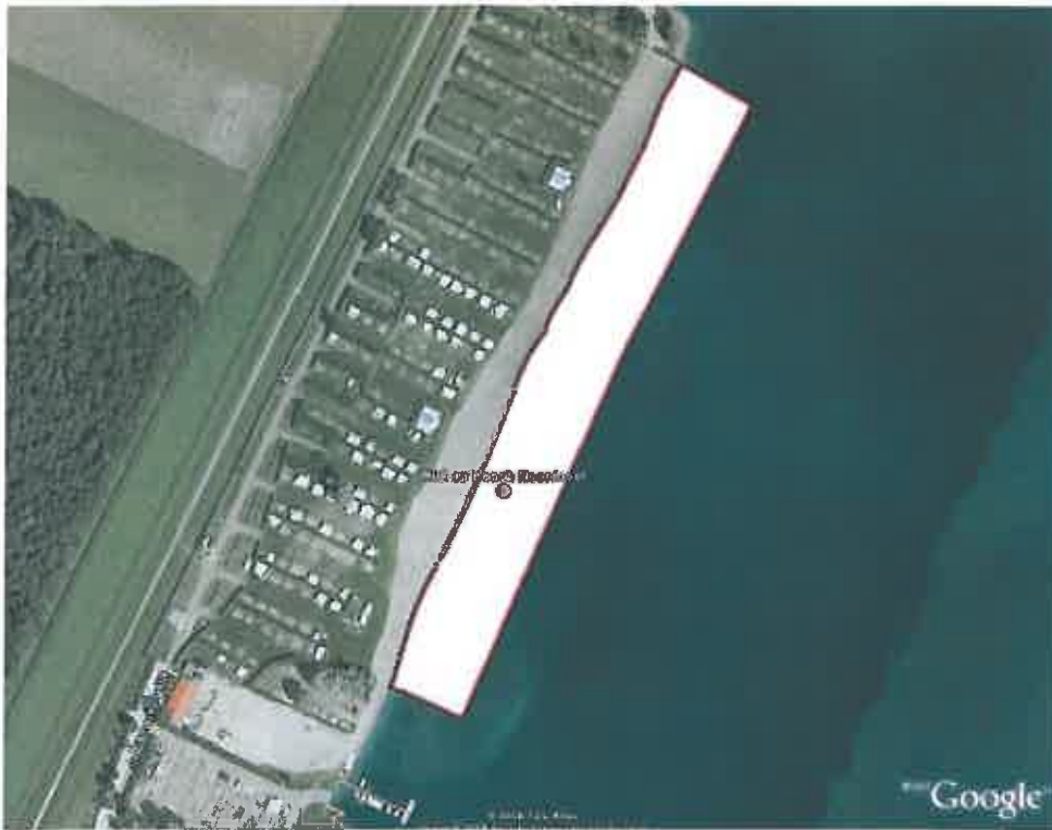
Zwemzone strand Riviera Beach Zuid, Dronten