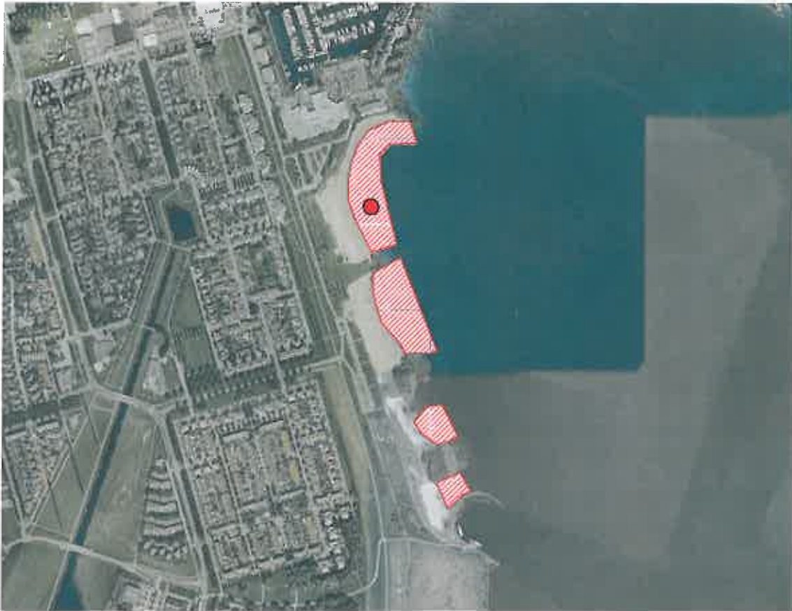
Zwemzone Erkermederstrand, Zeewolde