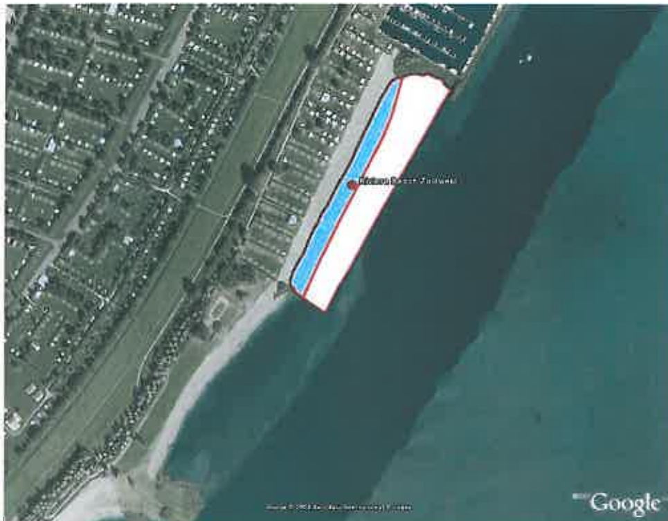
Zwemzone Ellerstrand, Dronten