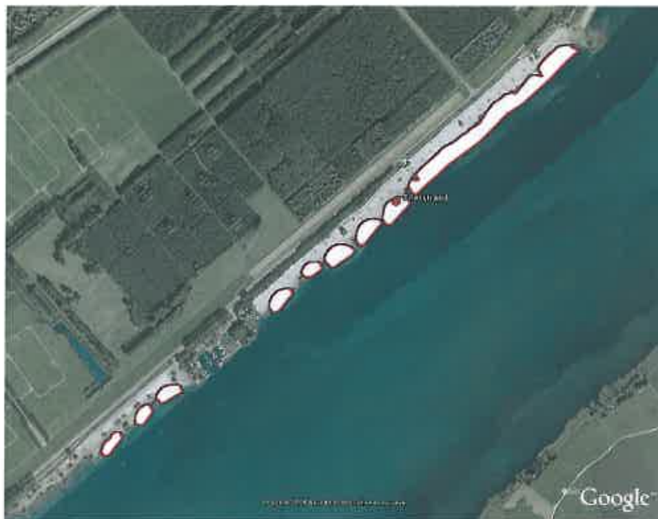
Zwemzone Harderstrand, Dronen