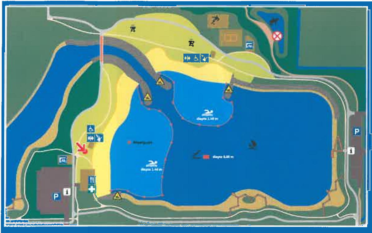
Zwemzone strand Houtribhoek, Lelystad