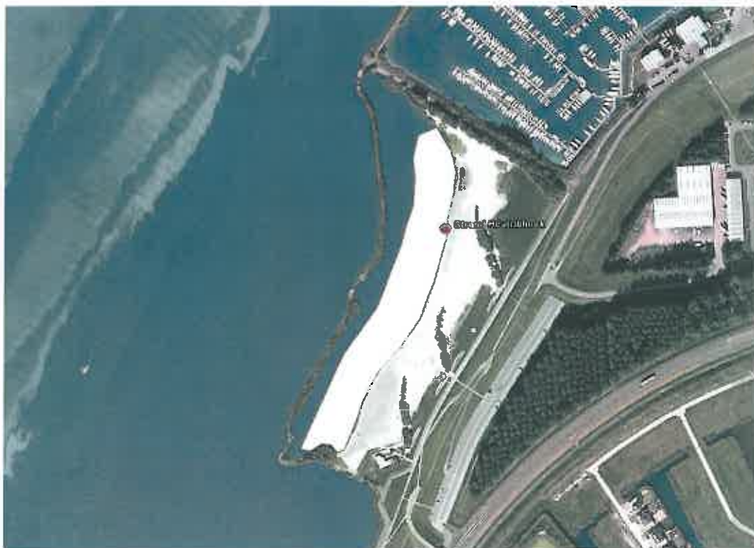
Zwemzone strand Abbertstrand, Dronten